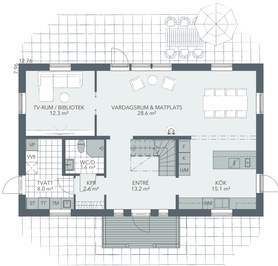
PLAN 1. SKALA 1:100